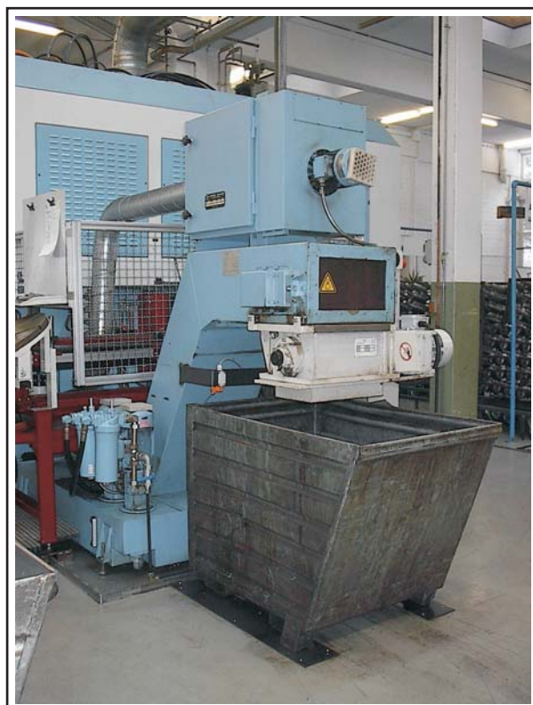
Posizione di lavoro.