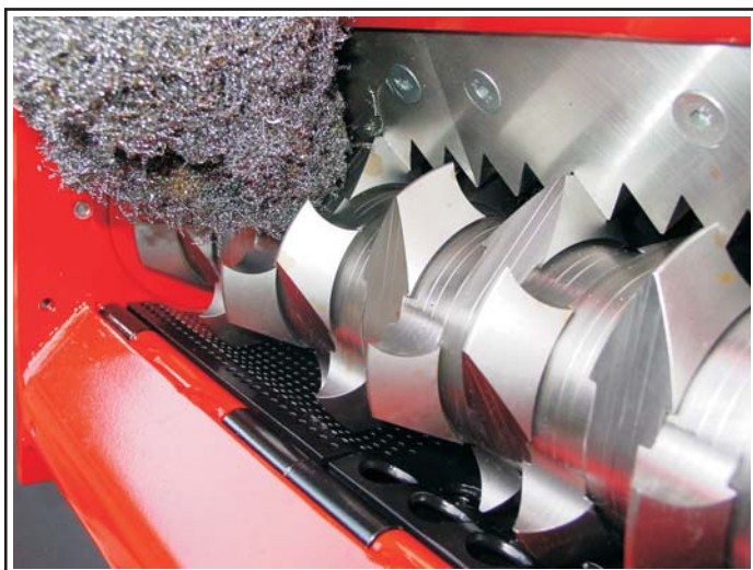
La foto mostra come vengono sminuzzati i trucioli.